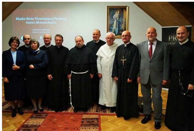
Nagrody „Pro Redemptione” 2016