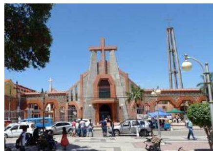
Nowy kościół franciszkanów w Montero

Po wielu latach wytrwałej pracy przy rozbudowie kościoła parafialnego i centrum katechetycznego Las Mercedes w Montero, w poniedziałek 30 października 2017 r. w liturgiczną rocznicę poświęcenia własnego kościoła, już od rana w świątyni gromadzili się wierni z parafii i okolic. Wszyscy chcieli uczestniczyć w historycznym wydarzeniu, jakim była konsekracja kościoła parafialnego w Montero.