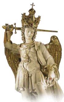
Figura Św. Michała Archanioła przez trzy dni gościła w Białej Podlaskiej. Wierni mogli się przed nią modlić i wypraszać łaski. W niedzielę zawierzyli

Akt poświęcenia się Św. Michałowi Archaniołowi i zawierzenia miasta jego opiece został dokonany podczas mszy świętej na Placu Wolności.